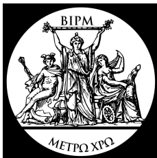
Bureau international des poids et mesures

Définition d'un système international d'unités :