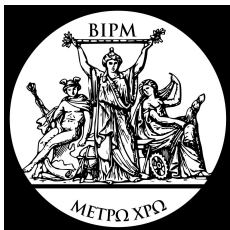
Bureau international des poids et mesures

Définition d'un système international d'unités :