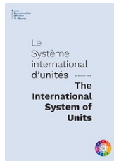
Brochure sur le SI publiée par le BIPM

https://www.bipm.org/utis/common/pdf/si-brochure/SI-Brochure-9.pdf